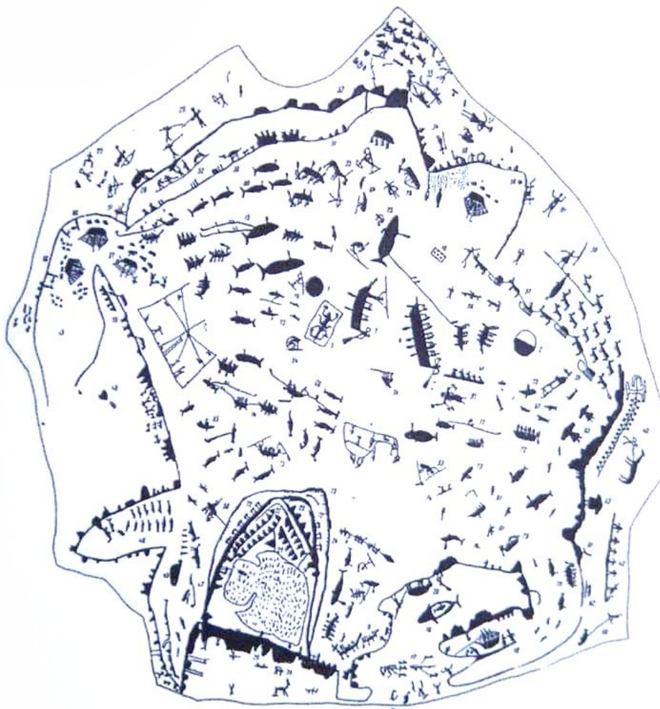
Рис. 28. Рыболов, охотничий на морской дельфине. Чукотка. Из Галереи

« [...] Émancipé des structures discursives de type linéaire, le cirque produit une syntaxe analogique et discontinue dont se rapprochent d'autres écritures contemporaines. Le sens échappe par effilochures, il sourd des résonances entre la tessiture des langages, le mouvement des corps, la structuration de l'espace. L'enchaînement des scènes ou des tableaux dérouté la chronique narrative, en procédant par sautes d'images qui s'imbriquent dans les mystérieux dédales de l'esprit. Les circassiens distillent le sens dans la précision du geste, dans le clair-obscur des non-dits, dans l'affrontement charnel des élans du désir et de la mort, pour capter cela qui se dérobe à l'ordre cartésien et que l'esprit tente d'imposer au cœur. Malgré l'apparent éclatement du récit un sous-texte se trame, qui confère une cohérence globale à l'ensemble disparate des signes. Les langages de la piste filtrent dans les interstices de la rationalité, là où la rhétorique se heurte à la complexité de l'être et à l'insaisissable réalité. »