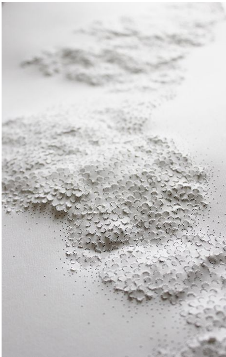
Mat3r Dolorosa, A Noisy Blast – Sun of light