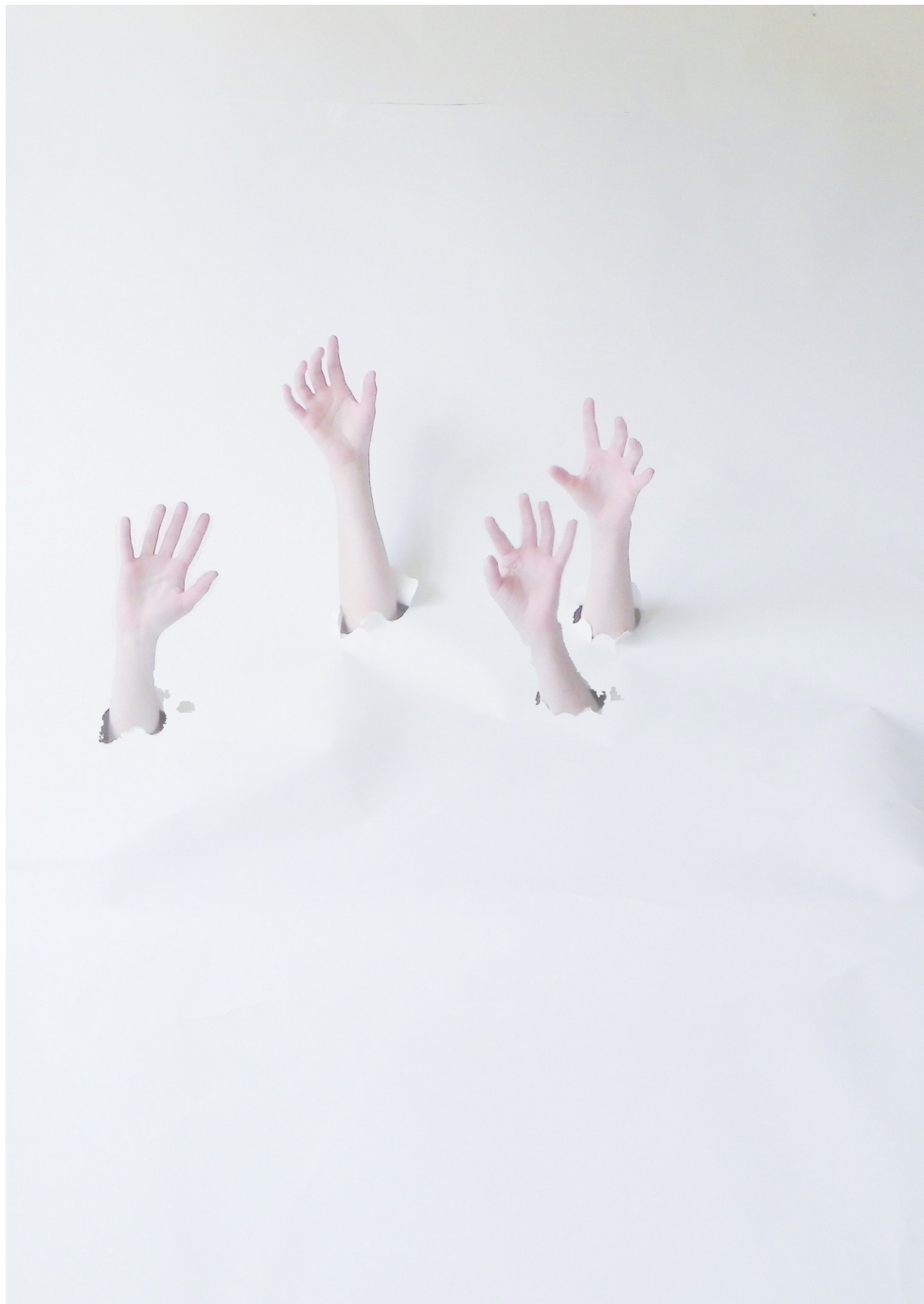
Visuel temporaire du projet inspiré par Gilly Face, The Assassin seas, 2012