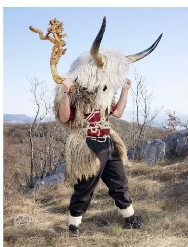
Charles Fréger. Wilder Mann, 2010.