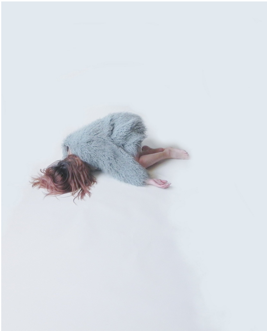
Visuel temporaire du projet inspiré par Anja Niemi Starlets 2013