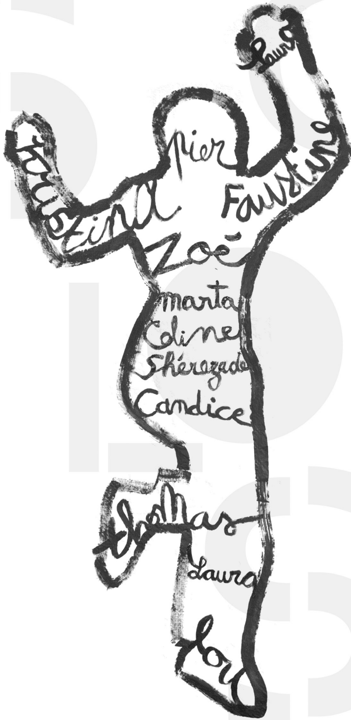
Image de couverture réalisée par Fabrication Maison avec les élèves de la 10e promotion.