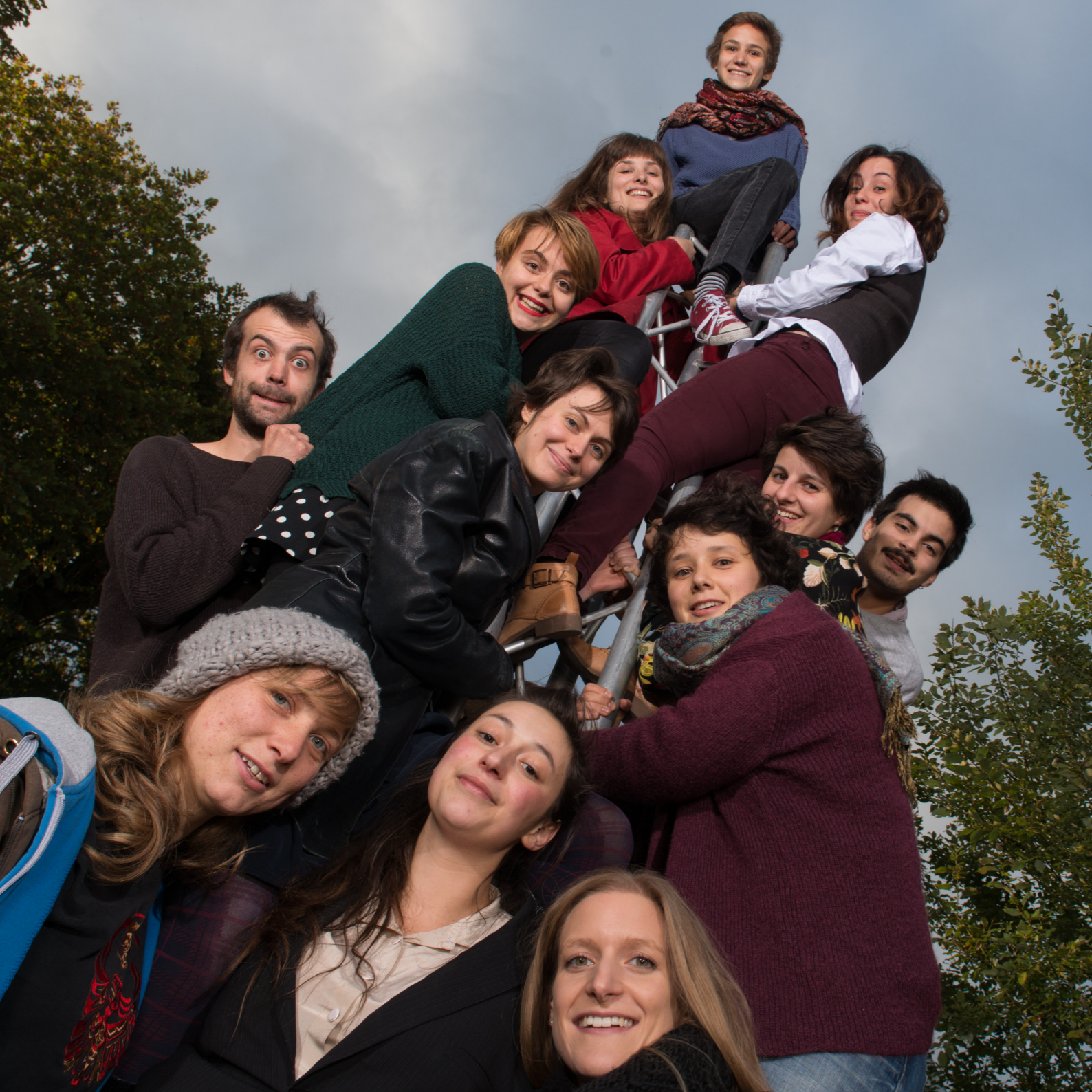
Image de couverture réalisée par Fabrication Maison avec les élèves de la 10e promotion.

Pour assister à l'ensemble des solos, possibilité de combiner les 2 séries de 6 solos (1h30 par série)